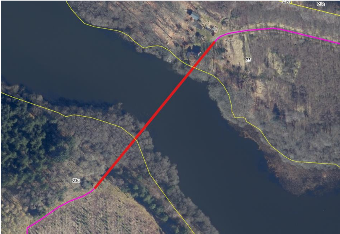
Figur 2: Krydsningspunkt, Gudensø/Gudenå ml. matrikel 23 Siim By, Dover og 23u, Gl. Rye By, Gl. Rye. Krydsningen udføres via styret underboring.